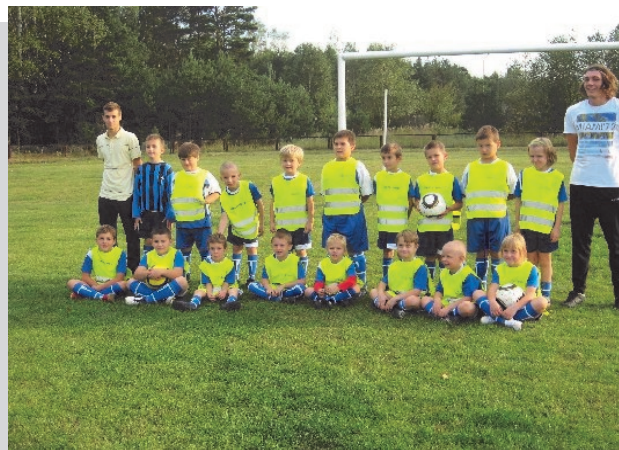
Drużyna Żaków KS Unia Kalety w komplecie

Zarząd Klubu Sportowego Unia w Kaletach składa serdeczne podziękowania za pomoc w wyremontowaniu zejścia do piwnicy budynku klubowego. Wszystkim biorącym udział w tej akcji należą się słowa uznania za szybką i bezinteresowną reakcję.